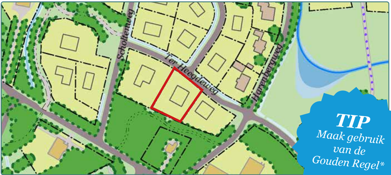
Situatietekening kavel 170