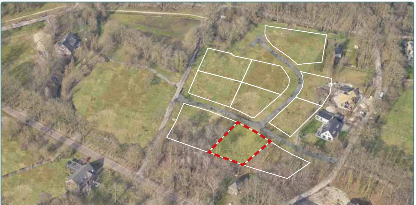
Kavel 170 vanuit de lucht